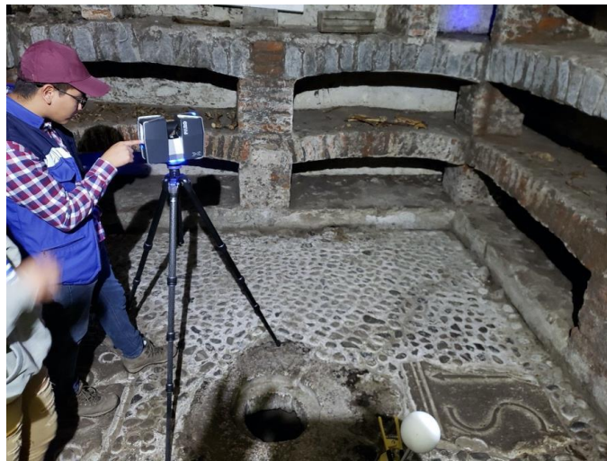
Ilustración 1. Levantamiento con Escáner Láser Focus 3D en las Catacumbas de la Iglesia Nuestra Señora de las Nieves de Sicalpa Viejo.